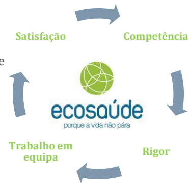
Valores da Ecosaúde

Prestar serviços de medicina, de segurança, higiene e saúde no trabalho, contribuindo para o estabelecimento e manutenção das condições de trabalho nomeadamente através de uma tomada de atitude pró ativa e preventiva, que assegurem o bem-estar dos trabalhadores abrangidos, segundo os padrões profissionais definidos, em observância de legislação em vigor, e concorrendo para a melhoria da performance das empresas Clientes.